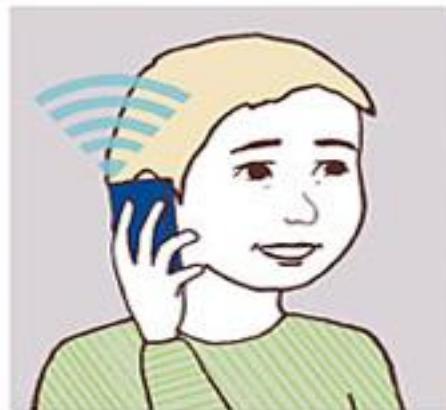
Telefon 40 kr