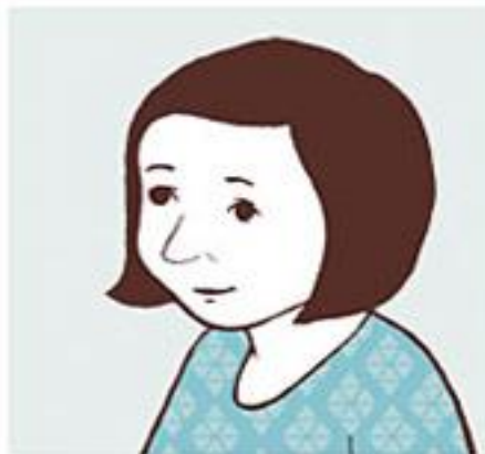
Personlig oppmøte 80 kr