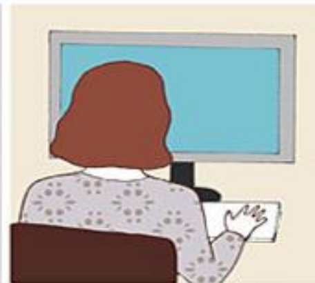
Digital selvbetjening 3 kr